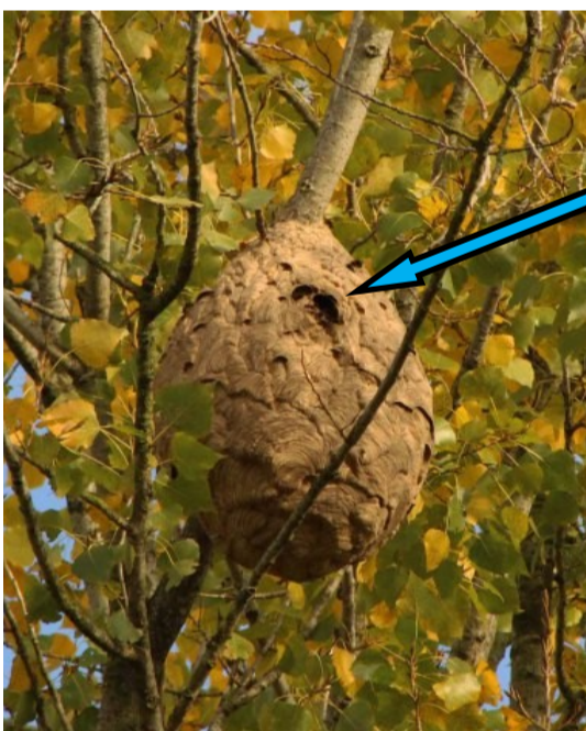
Trou d'entrée du nid sur le côté

peut atteindre 80cm de diamètre La plupart du temps dans les arbres à des hauteurs d'une quinzaine de mètres