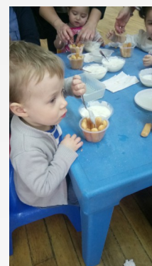
Atelier Cuisine à Arrest