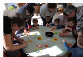
Manipulation de Pâques à Vaudricourt