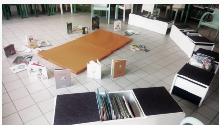
Bébés lecteurs à la Bibliothèque de Cayeux sur Mer