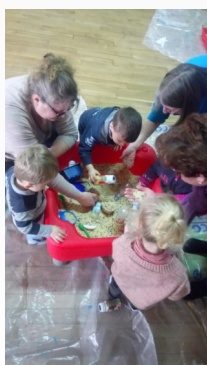
Manipulation à Arrest