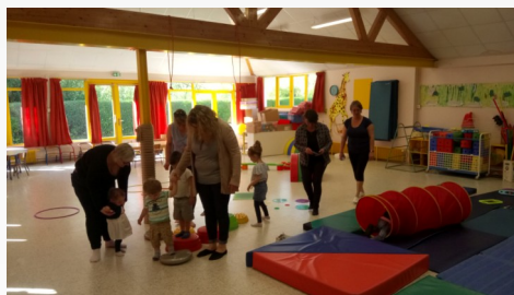
Motricité à l'école Maternelle de St Valéry